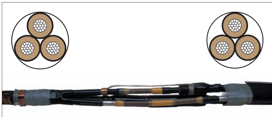
3-х жильный кабель